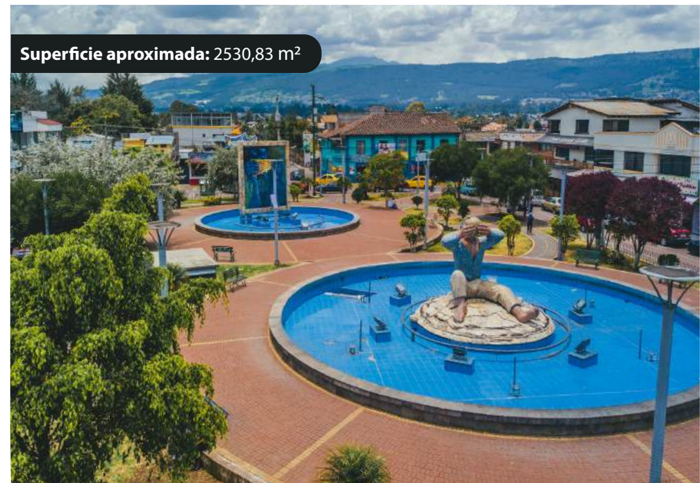
*El mantenimiento se realizará exclusivamente en el área verde del espacio intervenido. No contempla trabajos en los monument ni en el mobiliario existente